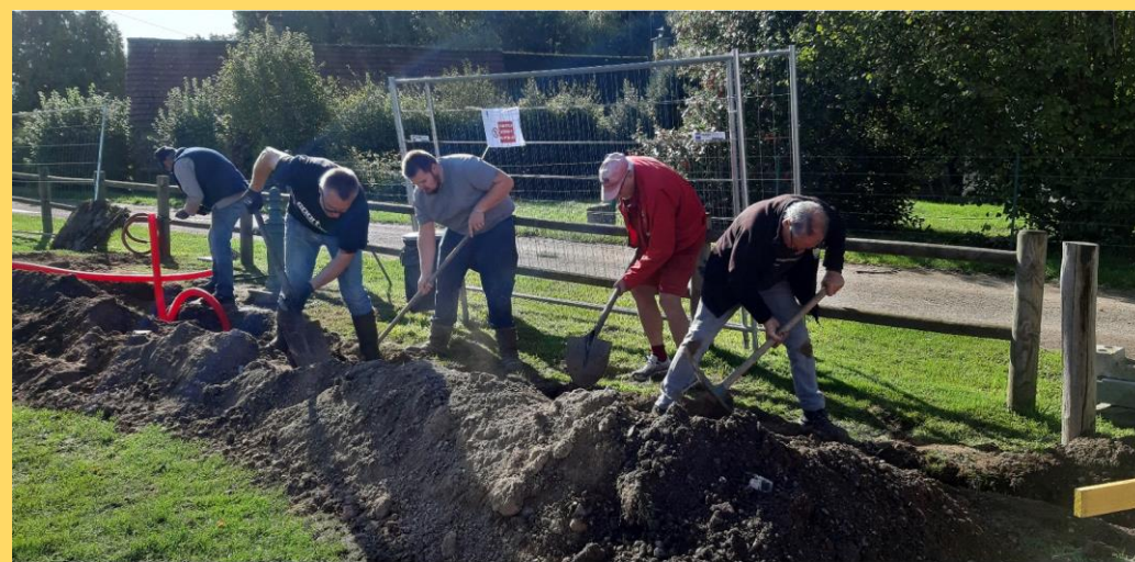
On rebouche les tranchées d'eau et d'électricité