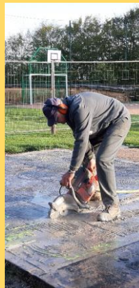
Découpe de la dalle