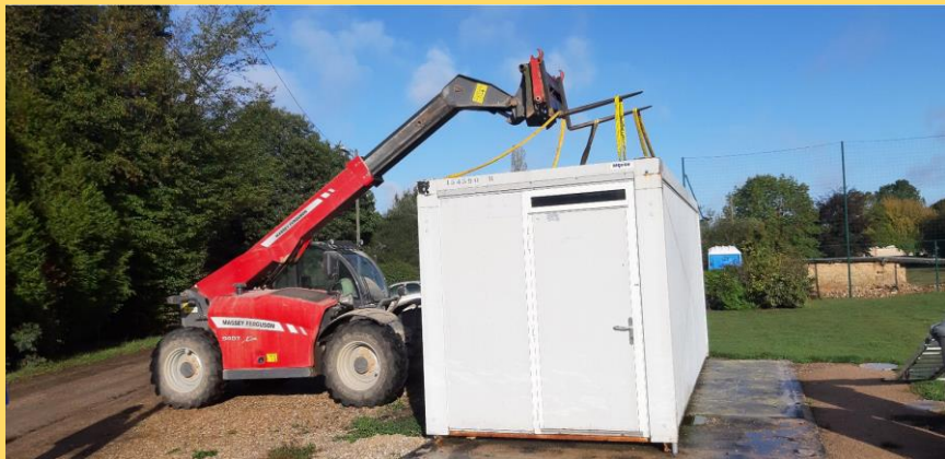
Débarras de l'Algeco