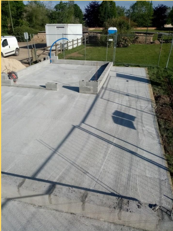
Coulage de la chappe de béton