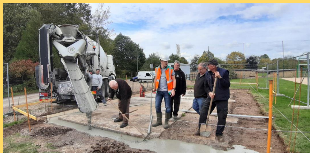
On coule les fondations