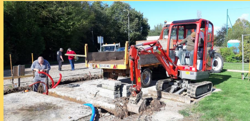
Creusage fondations & Installation tuyaux